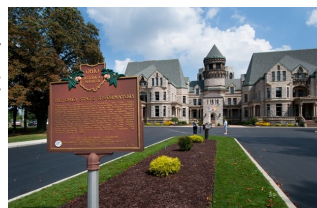
Ohio State Reformatory in Mansfield, Ohio

สุดท้ายทุกคนต้องจ่ายค่าหนังสือเดินทาง และค่าวีซ่าของตน พร้อม 15,000 บาท